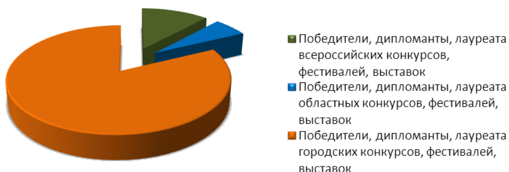
Достижения обучающихся в 2011-2012 уч. году.

Таким образом, к основным предпосылкам создания Программы развития относятся: